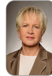
Dagmar Winner Winner Consulting, Berlin